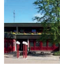
St. Loreto Ludwigsburg