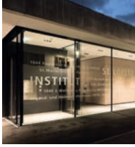
St. Loreto Schwäbisch Gmünd