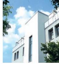
St. Loreto Ellwangen