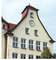
St. Loreto Aalen