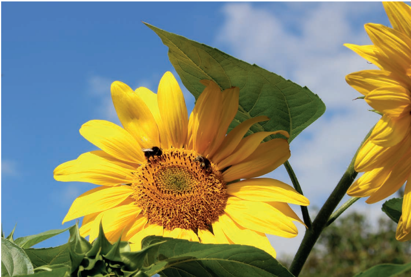
Titelbild: Regenbogen bei unserem Haus in Immenstaad